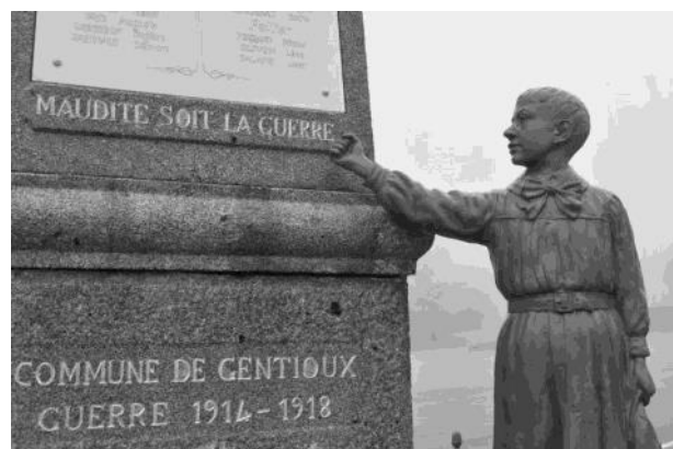
Monument pacifiste de Gentioux