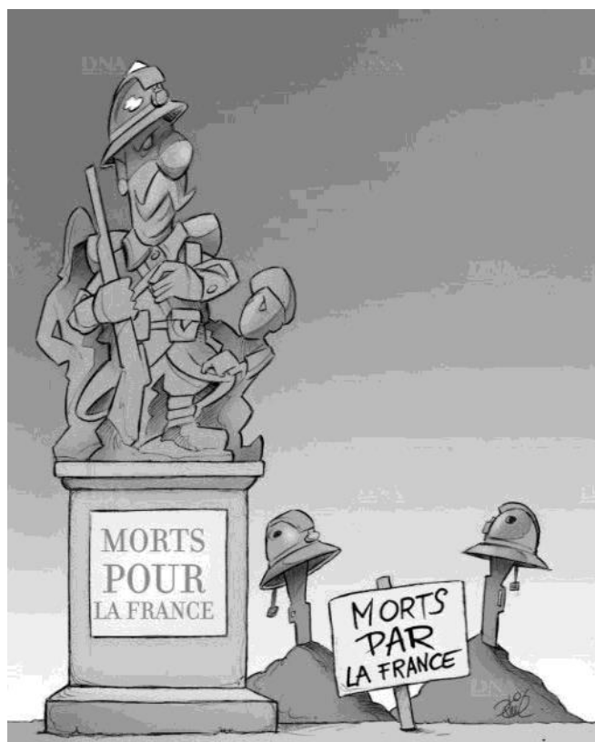
Dessin de Phil Umbdenstock publié par les Dernières Nouvelles d'Alsace (5 janvier 2019)

le combat se poursuit le samedi 6 avril 2019 à Chauny