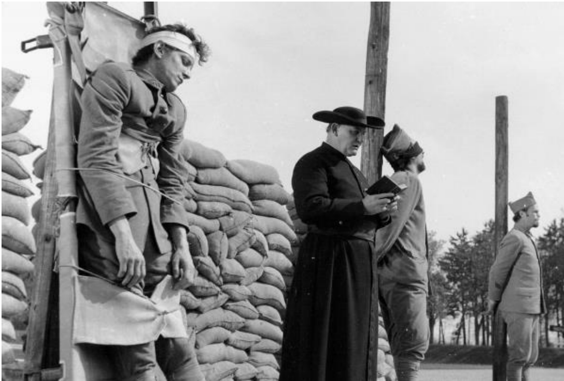
Photo extraite du film « Les sentiers de la gloire » de Stanley Kubrick

Érection du monument réhabilitant les Fusillés pour l'exemple