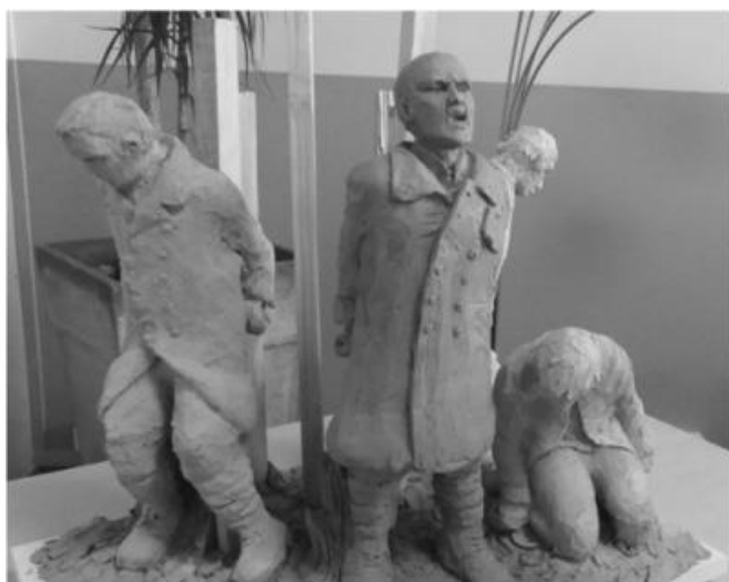
Maquette du monument de Chauny