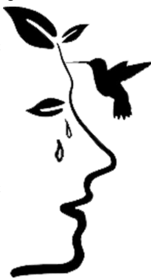
Le seul oiseau capable de voler en arrière