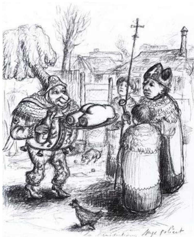
Illustration Serge Poliard : La bénédiction - LP59

Le bureau comptait sur la participation de notre amie polonaise Wanda Nowicka. Elle n'a pas pu se libérer aujourd'hui mais elle réserve une journée pour nous en première partie de notre Assemblée du samedi 23 juin préparatoire au Congrès national à Saint-Herblain.