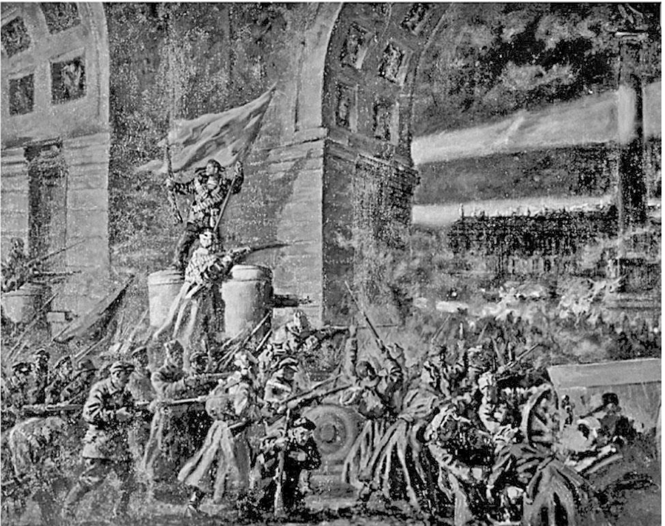
La prise du palais d'Hiver, tableau de Pavel Sokolov-Skalia, musée d'État russe, Saint-Petersbourg

(*) Voir page suivante l'article de Louis Couturier à propos d'un texte de Lénine publié dans la « Novaïa Jizn » du 3 décembre 1905.