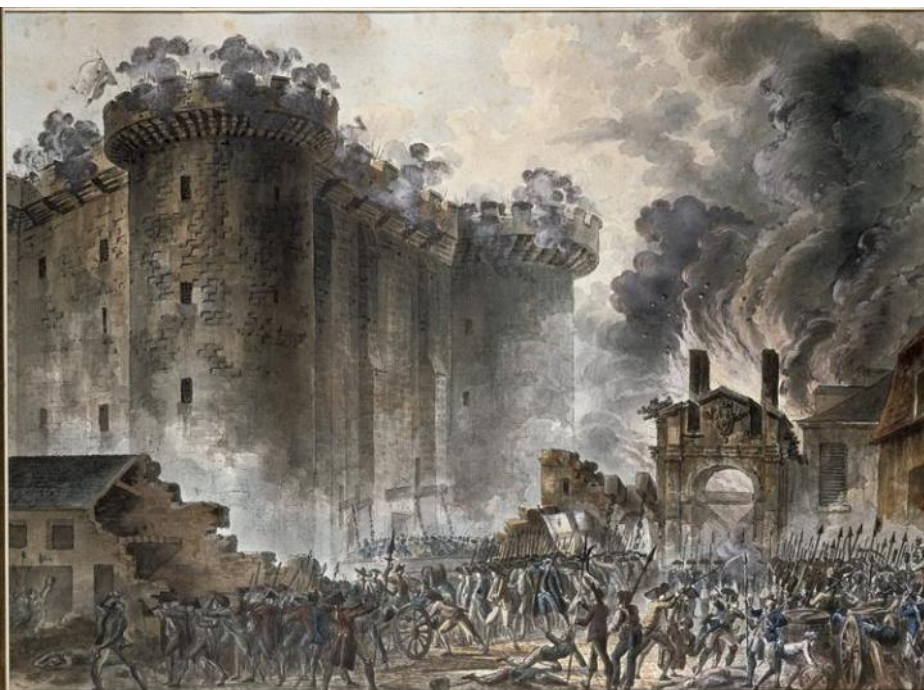
Vue du siège de la Bastille, tableau de Jean-Pierre-Laurent Houel - Musée Carnavalet, Paris

L'autre ressemblance essentielle est le combat pour la rupture avec le pouvoir religieux. La Révolution française a eu du mal à se dégager de la religion d'état : si on garde le roi, le clergé doit être fonctionnarisé, d'autant qu'en confisquant ses biens, on le prive de revenus. Ce qui conduit à la guerre civile avec les prêtres réfractaires (car tout fonctionnaire doit prêter serment...une formalité...) Quand la République est proclamée, la Séparation s'impose dans les faits. Napoléon en rétablissant le concordat redonne le pouvoir politique à