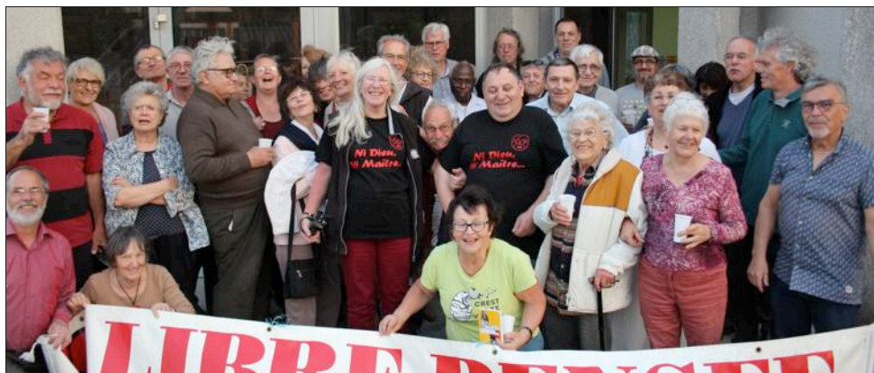
Les convives du repas de Saint Beuve perdurent la tradition en organisant ce rendez-vous anticléricale.

À l'occasion du vendredi dit saint, la Libre pensée Ardèche Drôme a perpétué, au restaurant scolaire, comme chaque année, la tradition anticléricale du 10 avril 1868. Initié par Saint Beuve et Flaubert autour d'un repas "gras" contre tous les interdits religieux ce rendez-vous annuel perdure. Anticléricale, rationaliste, internationaliste, pacifiste et sociale, la Libre pensée milite pour une application