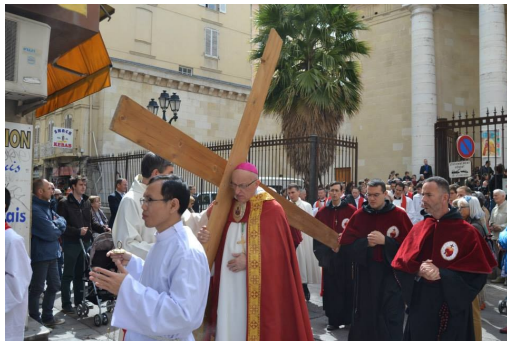
- Évêque de Fréjus-Toulon

En ce week-end de Pâques 2015, le vendredi dit "saint" (ou malsain, c'est selon), les évêques sont de sortie avec leurs ouailles et leur outil de travail pour cette parade ostentatoire. Ils présentent cette allégorie chrétienne à la foule. C'est à celui qui arborera la plus grande !