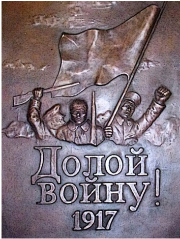
Bronze du monument de La Courtine

C'est sur cette phrase, comme un clin d'œil, que se terminait cette excellente émission de Jean Lebrun sur France Inter le 18 septembre dernier : « la marche de l'Histoire », émission dans laquelle fut relatée dans tous ses détails la mutinerie des soldats russes à la Courtine, contribuant à la faire connaître au grand public et soulignant ainsi l'incongruité de cette demande de pardon.