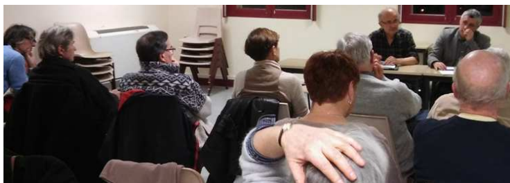
le 20 mars à Guéret : conférence "islam et laïcité"