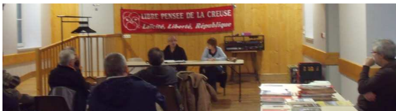
à Banize le 31 mai

C'est sur ce thème qu'était animée la soirée-débat à Châtelus-le-Marcheix le 10 février (lire le compte rendu dans le N° précédent de ce bulletin). Sur le même thème d'autres soirées se sont tenues et se tiendront dans le département, saluant au passage les nombreuses bannières plus que centenaires, ayant appartenu aux nombreux groupes de libres penseurs qui militaient en Creuse au début de la Séparation de l'Église et de l'État en France.