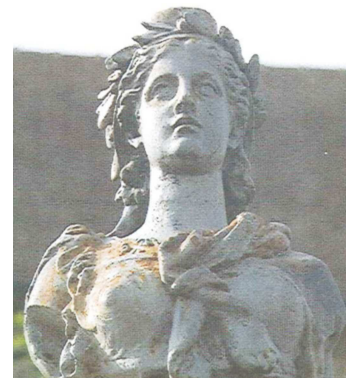
Détail du "calvaire des libres penseurs" à Naillat

Prochaine soirée-débat : vendredi 2 juin à NOTH petite salle de la Poste, 20H